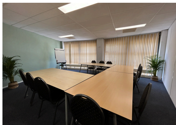
ons trainingscentrum in Hoogland (Amersfoort)